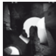
Di-Construction, 2009 cm 50x50

Fotografie che racchiudono apparizioni, le opere di Savi dichiarano una matrice immaginifica che è anche manifesto poetico, scegliendo di ripensare il reale attraverso una fenomenologia fantastica.