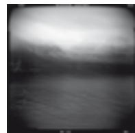
Wood, 2009 cm 50x80