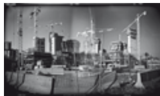
Cantiere, 2009 cm 50x80