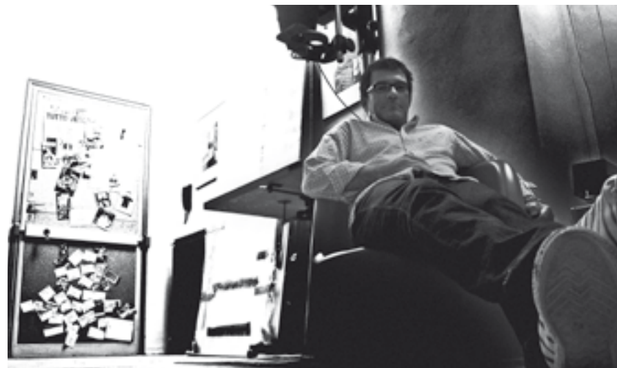
Sopra. autoritratto di Enrico Savi. In copertina: particolare da Wood, 2009, cm 100x200